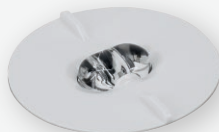
SC z soczewką korytarzową