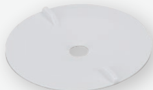
SX bez soczewki